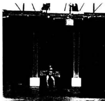
Alto show a bajo costo en el Nuevo Teatro Garibaldi

Los únicos que sobreviven son "Teatro Colonial" situado en Avenida Lázaro Cárdenas número 91 y el "Nuevo Teatro Garibaldi" situado sobre la misma Avenida en el número 43-A.