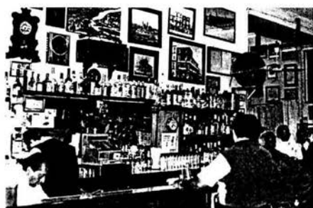
EL Nivel, sexenios de variedad y tradición.

Se dice que en una ocasión, ya siendo presidente de México, Lerdo de Tejada pasó en su carruaje hacia el Palacio Nacional, y observó que "El Nivel" había sido cerrada como secuela de alguna de las últimas disposiciones de Juárez; inmediatamente redactó un escrito que hoy se mantiene en el Archivo General de la Nación en el que mandaba a abrir esa cantina para siempre.