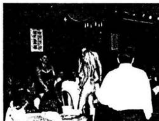
Mujeres esperan que les inviten una copa en Las Rocas