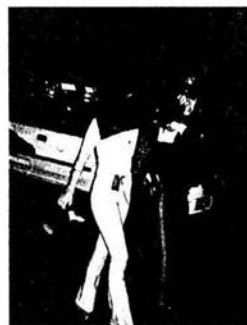
Por lenicidio trabajadora del Titanium al MP.

Por otra parte, de manera violenta e imprevista, el secretario de Gobierno, Leonel Godoy y el procurador de Procedimientos Penales de la Procuraduría capitalina, Hugo Vera, se dirigieron al negocio "clave" por ser presumible propiedad de los hermanos Iglesias Rebollo, el table dance "Titanium", ubicado en la calle de Durango número 169 esquina Monterrey, en la colonia Roma.