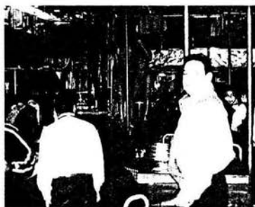
En la noche del Jet Set los clientes realizan todas sus fantasías