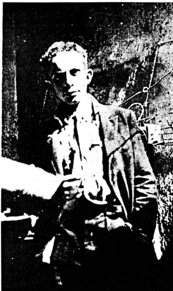
José Revueltas preso en las Islas Marías antes de cumplir los 18 años de edad.