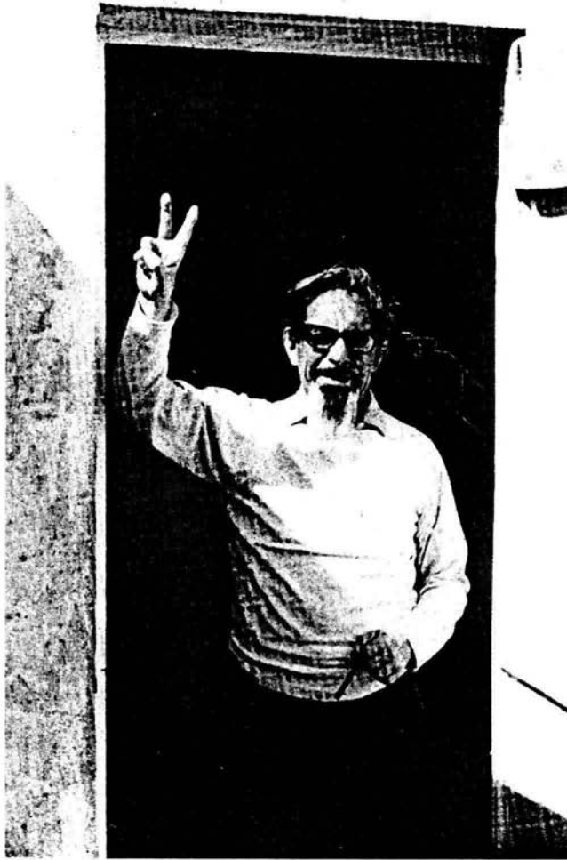
Revueltas en su celda de Lecumberri, preso como consecuencia de su participación en el Movimiento Estudiantil de 1968.