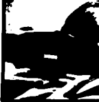
El Estadio es un periódico deportivo que se publica los días martes y viernes.