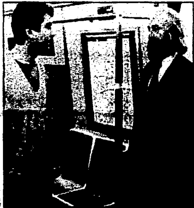
El cineasta mexicano se sincera. Cuarón tiene una amante. El director de "Y tu mamá también" y el actor de "Amores perros".

"La industria del cine estadounidense me ha puesto casa y he tenido hijos con ella, pero de ninguna manera estoy amarrado a ella", parafrasea el cineasta mexicano sobre su éxito en la Meca del Cine