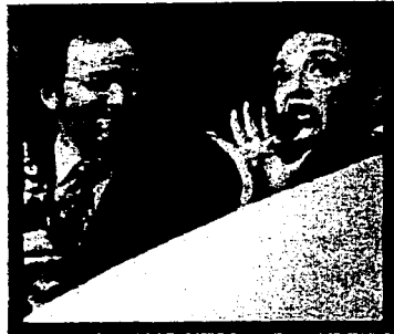
Katy Jurado siempre el sabor en la entrega del "Ariel"