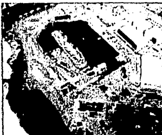
El estadio de Fox, con una capacidad de 60 mil personas, se encuentra en el centro de la ciudad de Popotlán, Jalisco.

El estadio de Fox, con una capacidad de 60 mil personas, se encuentra en el centro de la ciudad de Popotlán, Jalisco. El estadio de Fox, con una capacidad de 60 mil personas, se encuentra en el centro de la ciudad de Popotlán, Jalisco.