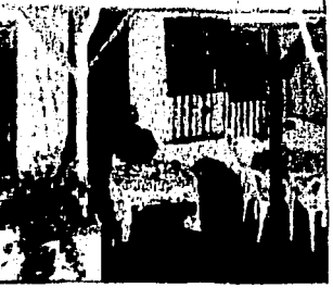
El equipo de la película Titanic en Popotla.

En 17 hectáreas de terrenos, sobre la costa del Pacífico, a 10 minutos de Rosarito, B.C., se encuentran los Baja Studios, considerados los sets marinos más grandes del mundo.