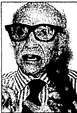
El actor en el rol de Gabriel Figueroa, protagonista de “La perla”, el más importante de sus filmes.

“Yo voy a estudiar a actuar, yo voy a estudiar a actuar, yo voy a estudiar a actuar”, dijo el actor. “Yo voy a estudiar a actuar, yo voy a estudiar a actuar, yo voy a estudiar a actuar”, dijo el actor. “Yo voy a estudiar a actuar, yo voy a estudiar a actuar, yo voy a estudiar a actuar”, dijo el actor. “Yo voy a estudiar a actuar, yo voy a estudiar a actuar, yo voy a estudiar a actuar”, dijo el actor.