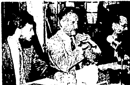
Singular presentación la del libro de Carlos Fuentes, en compañía de sus huéspedes y amigos.

Posteriormente el ex diplomático leyó algunos fragmentos del relato Los hijos de la Compañía, que dedicó a su amiga Ileana Polietzka, quien por cierto celebró su cumpleaños número 80.