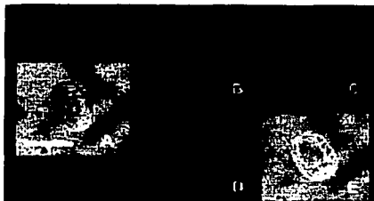
Quistes de Giardia duodenalis .