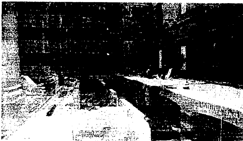
Hallazgos de diferentes piezas prehispánicas , Muros de cuartos de la época del Virrey de Gálvez, localizados en el Castillo de Chapultepec Agosto 2000