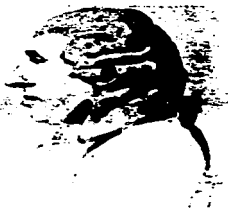
Retrato de Haydn en 1794

Y es justo en ese año en el que Haydn compuso su sonata Hob. XVI-52 en Mi bemol Mayor.