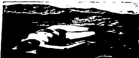
Felipe Gutiérrez (1824 - 1904)

La cazadora de los Andes ca. 1891 Óleo sobre tela 102.00 X 159.00 cm Museo Nacional de Arte. INBA, CONACULTA