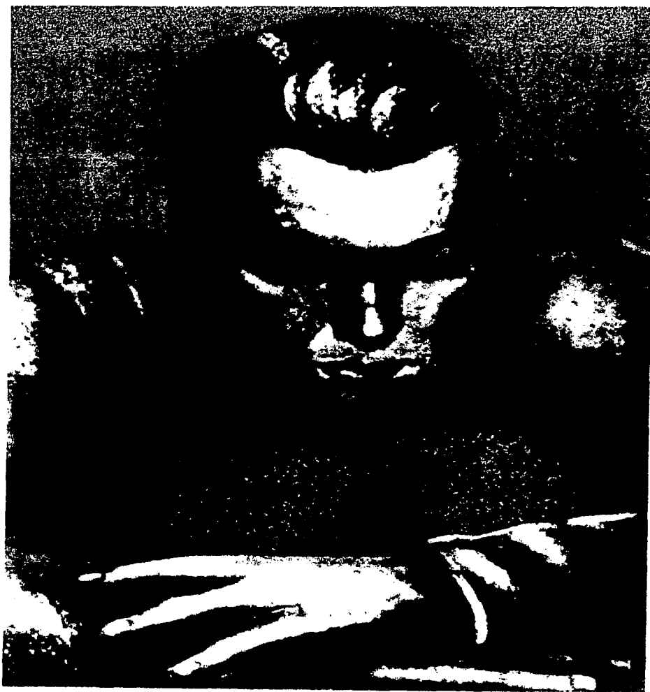
HART CRANE DETALLE DE UN RETRATO DE DAVID ALFARO SIQUEIROS