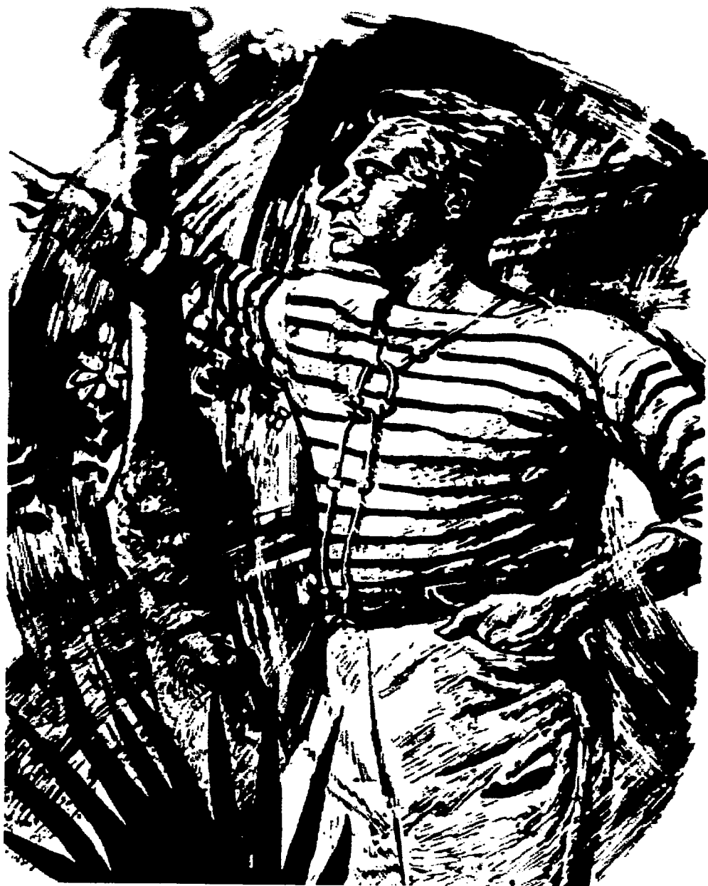
CRANE EN MEXICO DIBUJO DE JOHN JOHNS 1931