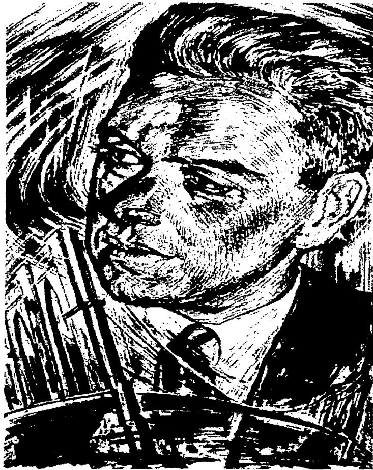
HART CRANE DIBUJO DE JOHN JOHNS 1929