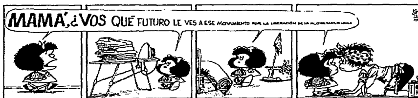
"MAMA, vos que futuro le ves a ese movimiento por la liberación de la muj... no, nada, olvidalo." Quino, 1973

"En nombre de la Alianza de Mujeres de México y de las agrupaciones presentes, acudo para presentar un mensaje de congratulación de la mujer mexicana que ha luchado por décadas para tener derechos políticos y que ahora los logra"