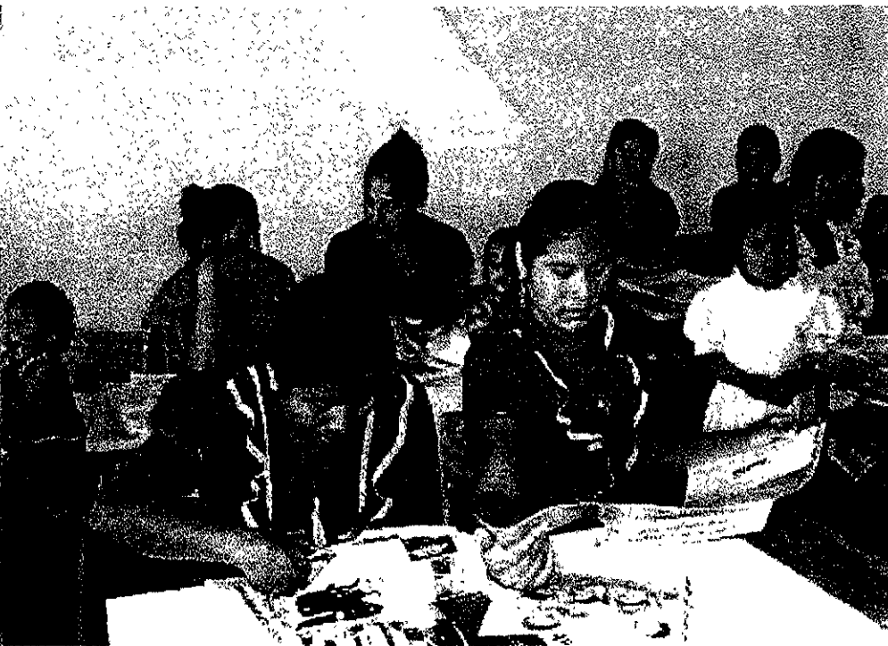
Sesiones grupales para la obtención de información.