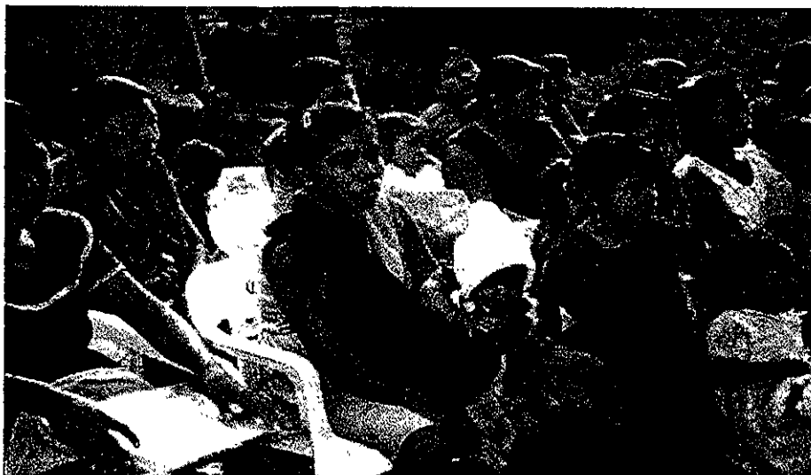
Madres de familia del sexto ciclo operativo de Educación Inicial Colonia Benito Juárez municipio de Soteapan, Veracruz.