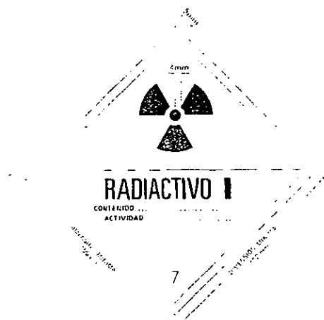
Etiqueta para la Categoría I Amarilla

CATEGORÍA I: El nivel máximo de radiación en cualquier punto de la superficie externa de los bultos será hasta 0,005 mSv/h. El fondo de la etiqueta será blanco, el trébol, los caracteres y líneas impresas serán negros, llevará la palabra "radiactivo" y una barra roja indicando la categoría.