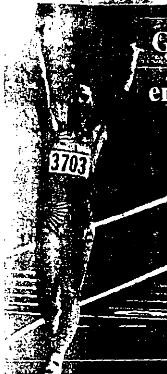
YELENA NIKOLAYEVA realizó su carrera y se adjudicó el título.