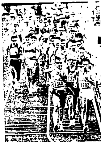
AL INICIO de la prueba, los maratonistas cruzan de los favoritos.

Aseguró que seguirá entrenándose en 20 y 50 kilómetros, “Siento que me hace falta caminar más competencias de 50, ahora sólo queda volver a los entrenamientos y seguir con el trabajo”.