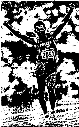
EL POLACO Robert Korzenowski, foto ganador de los 50 kilómetros.