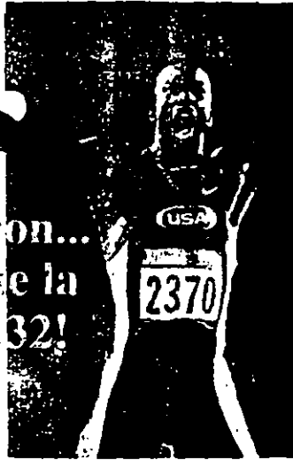
MICHAEL JOHNSON hizo historia al romper mundial de los 200 metros planos y conquistó su segunda medalla de oro.

La reacción de Johnson al disparo fue de 0.161, avan-