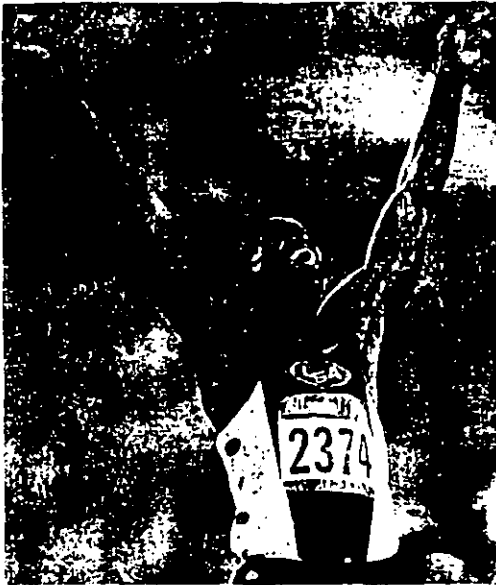
CARL LEWIS, simplemente es el más grande atleta de la historia.

La plata correspondió a Riger Black con 44.41 y