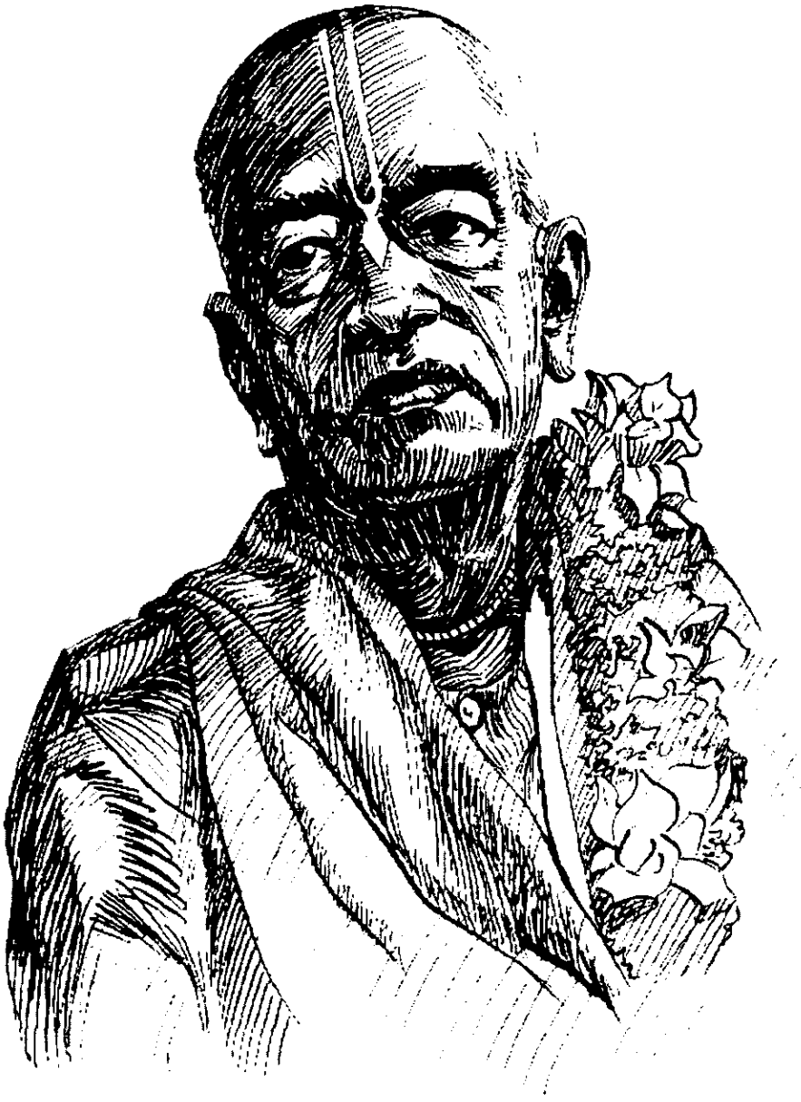
Sri Bhaktivedanta Swami Prabhupada