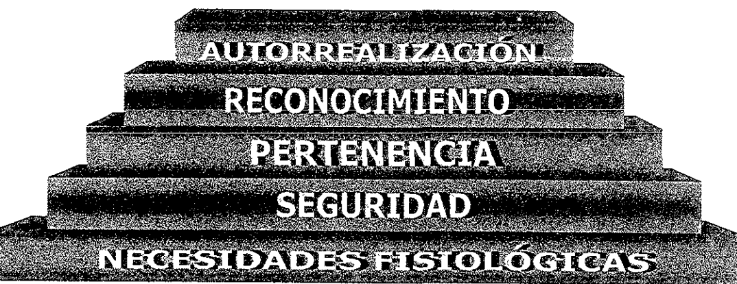
Fig. 1 Pirámide de Necesidades de Maslow.

Para explicar en que consisten las necesidades básicas y de crecimiento Rodríguez, M. (op cit.) señala la Pirámide de Maslow (1979) la cual está compuesta por cinco niveles, donde se distribuyen los dos tipos de necesidades: básicas o deficitarias y de crecimiento (Fig. 1).