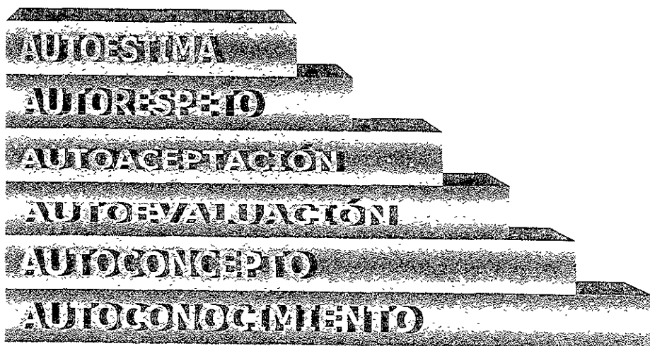
Fig. 2 Escalera de la Autoestima de Rodríguez Estrada.

Ahora bien, para Rodríguez, M. (op. cit) la autoestima constituye el elemento principal para alcanzar una autorrealización. Así, para poder conocer y desarrollar la autoestima es necesario cursar ciertos pasos (Fig. 2):