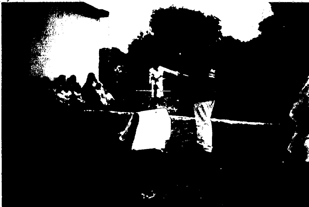
Foto 1. Presentación del Prestador de Servicio Social en la comunidad de el Pueblo de Matlaluca.

En El Pueblo de Matlaluca es preponderante la preocupación e interés en la obra de agua potable y en cualquier servicio que requiera su comunidad, su presencia política se refleja en sus representantes que dentro de la presidencia municipal tratan de beneficiar a su comunidad. La actividad productiva de cortar café la realizan principalmente los hombres en ejidos que se encuentran muy cerca, rumbo a Veracruz, dejando a las mujeres a cargo del hogar y de la educación de sus hijos; de hecho, existen familias que cuentan con un número no muy grande de hectáreas. Esta comunidad cuenta con primaria, una clínica de segundo nivel y la telesecundaria la tienen a dos kilómetros.