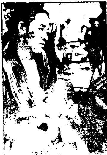
Fotada del 'Nagasaki Journey'