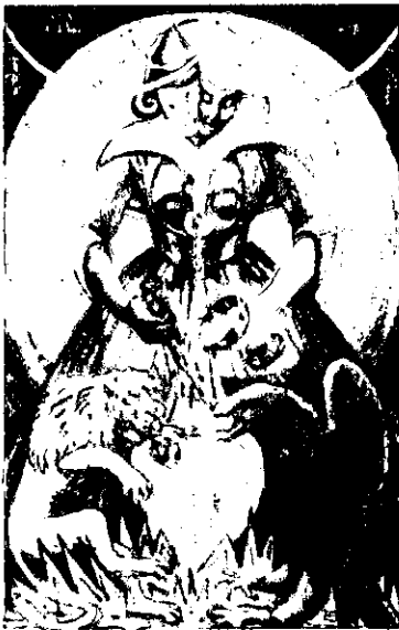
♃ Arte ♃