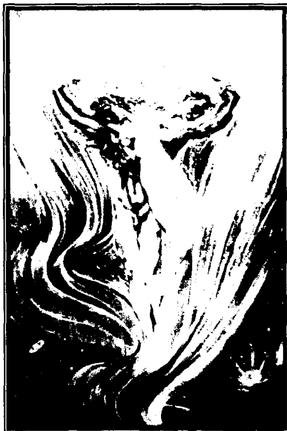
Fig. 16: EL amor de las almas , Jean Delville.