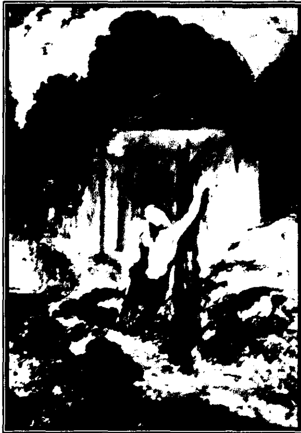
Fig. 6: Orfeo en la tumba de Euridice , Gustave Moreau, 1890.