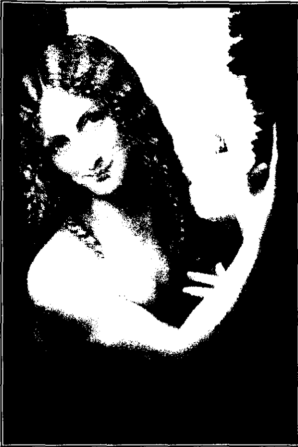
Fig. 1: San Juan Bautista , Andrea Salaino (f.S XIV-p.S XV).