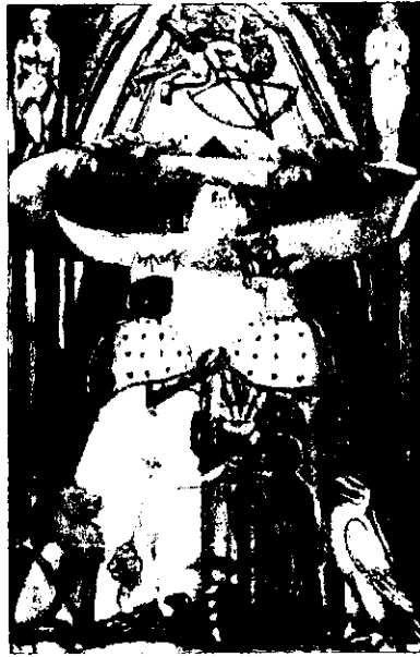
♄ The Lovers ♃