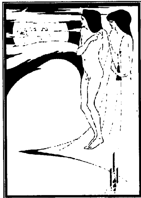
Fig. 18: El hombre en la luna , Beardsley.