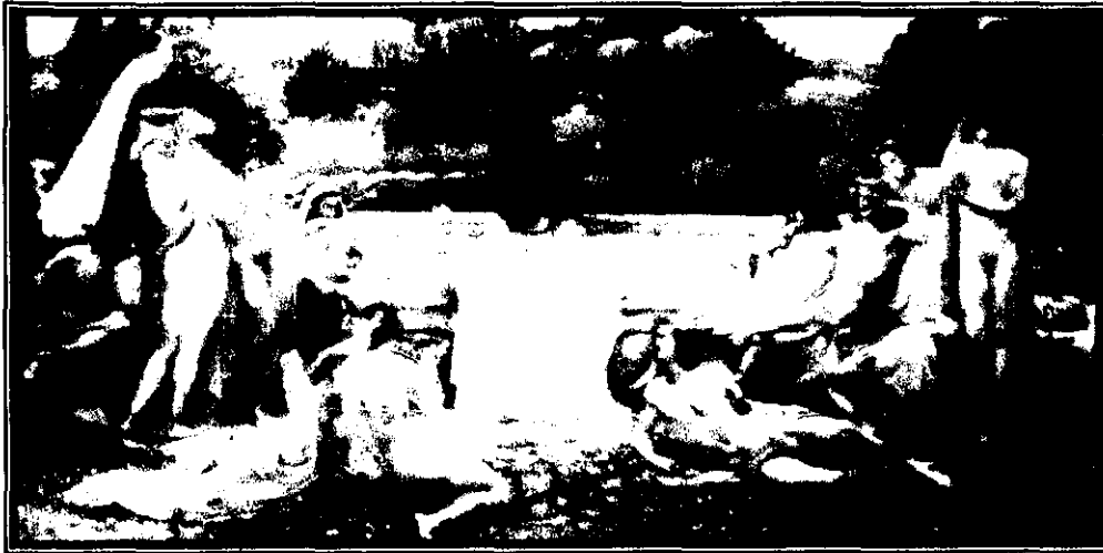
Fig. 7: La escuela de Platón , Jean Delville, 1897.