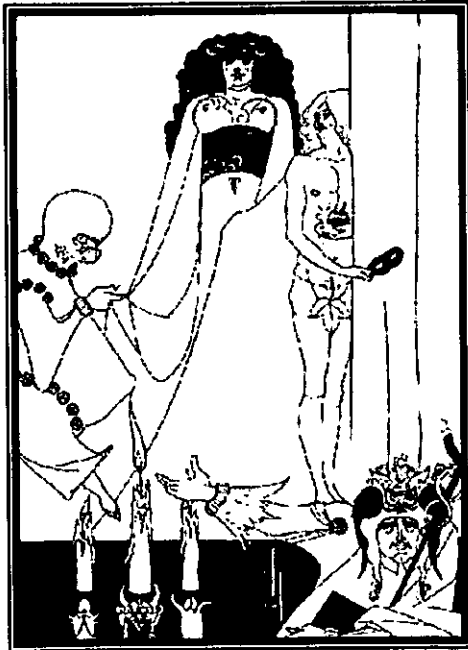
Fig. 20: Enter Herodias , Beardsley.