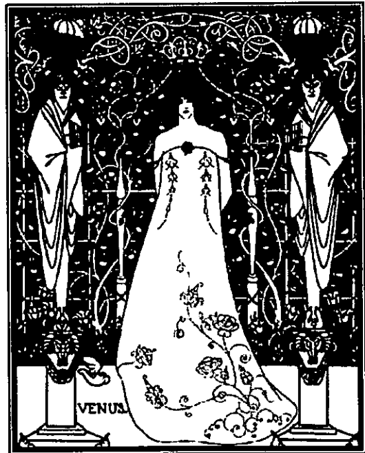
Fig. 21: Beardsley.