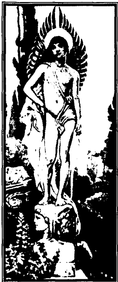
Fig. 11: Superest Invictus Amor , Elihu Vedder, 1889.