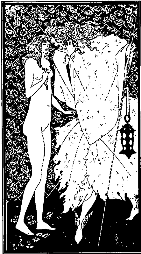
Fig. 17: El misterioso jardín de las rosas , Beardsley.