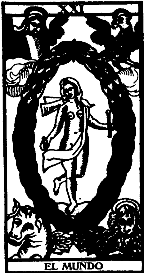
Fig. 25: El mundo , Tarot de Marsella.