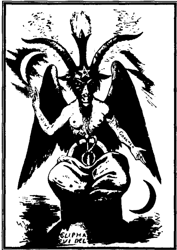
Fig. 10: La cabra sabática , Eliphas Lévi, 1896.