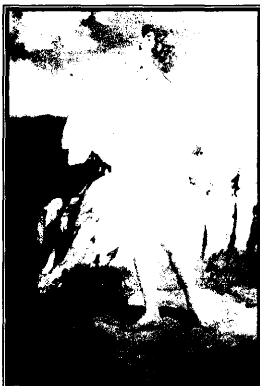
Fig. 12: Pintura de John Duncan, 1908.