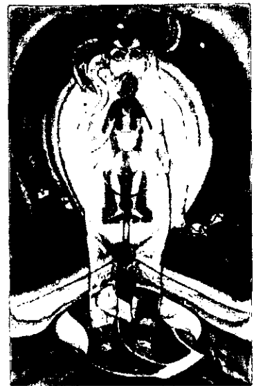
♃ The Aeon ♃