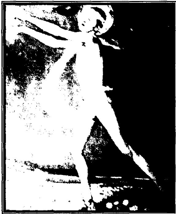
Fig. 14: Primavera , H.F. Heine, 1899.