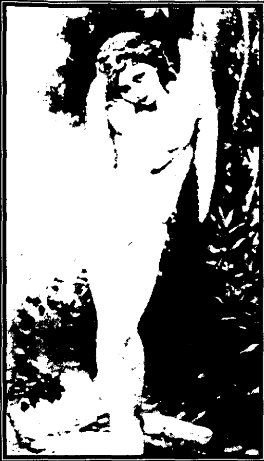
Fig. 13: Cupido húmedo , W. A. Bouguereau, 1891.