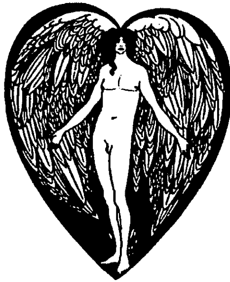
Fig. 19: Angel , Beardsley.