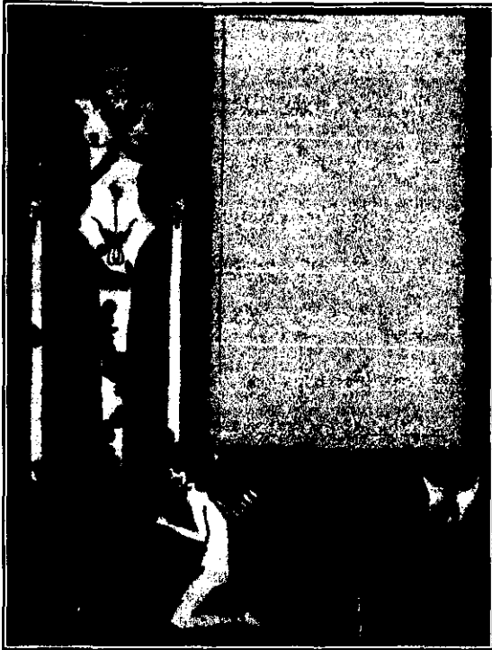
Fig. 9: Viñeta, Aubrey Beardsley.