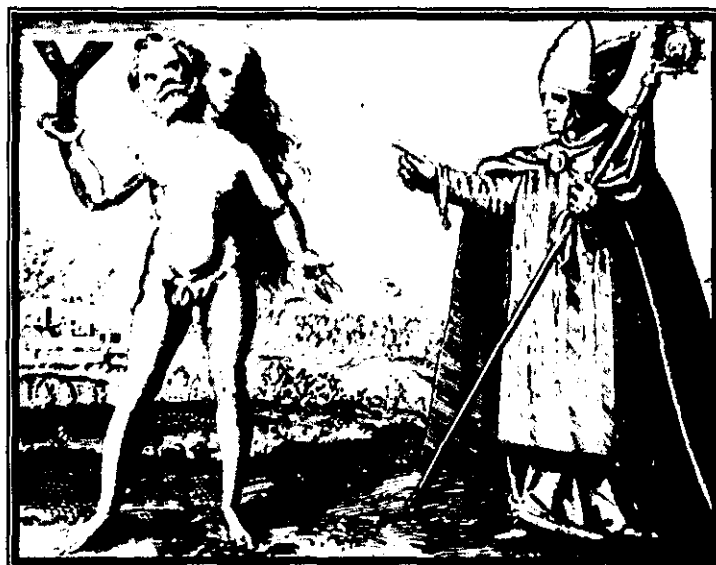
Fig. 4: Alberto Magno señalando al andrógino , Michael Maier, 1617.