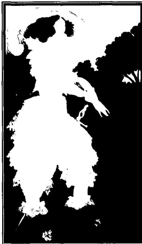
Fig. 8: Dibujo para Mademoiselle de Maupin , A. Beardsley, 1897.