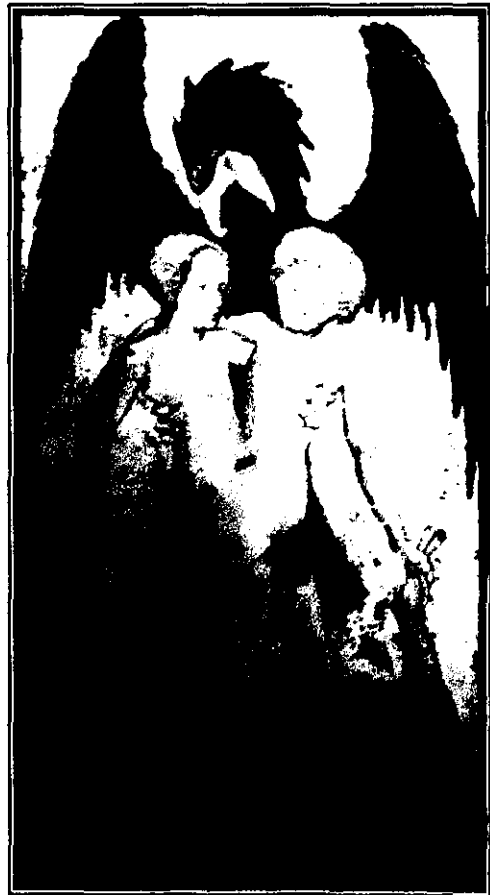
Fig. 2: Conjunción de los seres opuestos , finales del S. XV.