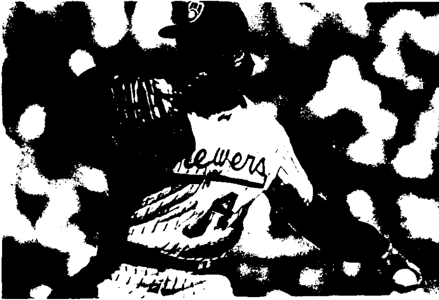
Los mejores beisbolistas mexicanos de todos los tiempos