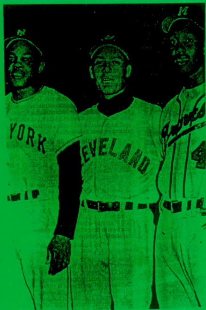
Los mejores beisbolistas mexicanos de todos los tiempos

Beto desde su llegada con los Indios se dio a respetar con todos sus compañeros quienes lo trataron muy bien durante los años en los cuales jugó con el conjunto.