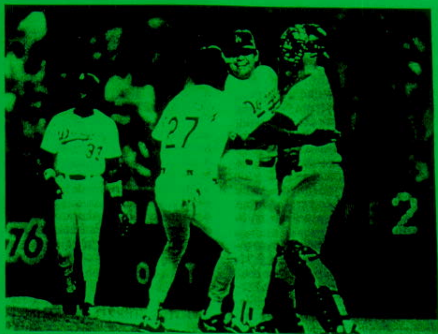
Los mejores beisbolistas mexicanos de todos los tiempos

Su primer partido sin permitir hit ni carrera –lo que es llamado un juego perfecto– se vio cristalizado en 1990 cuando los Dodgers se enfrentaron a los Cardenales de San Luis. Fue elegido jugador de la semana y logró como bateador el mejor promedio en su carrera con .304, un jonrón y 11 carreras empujadas.