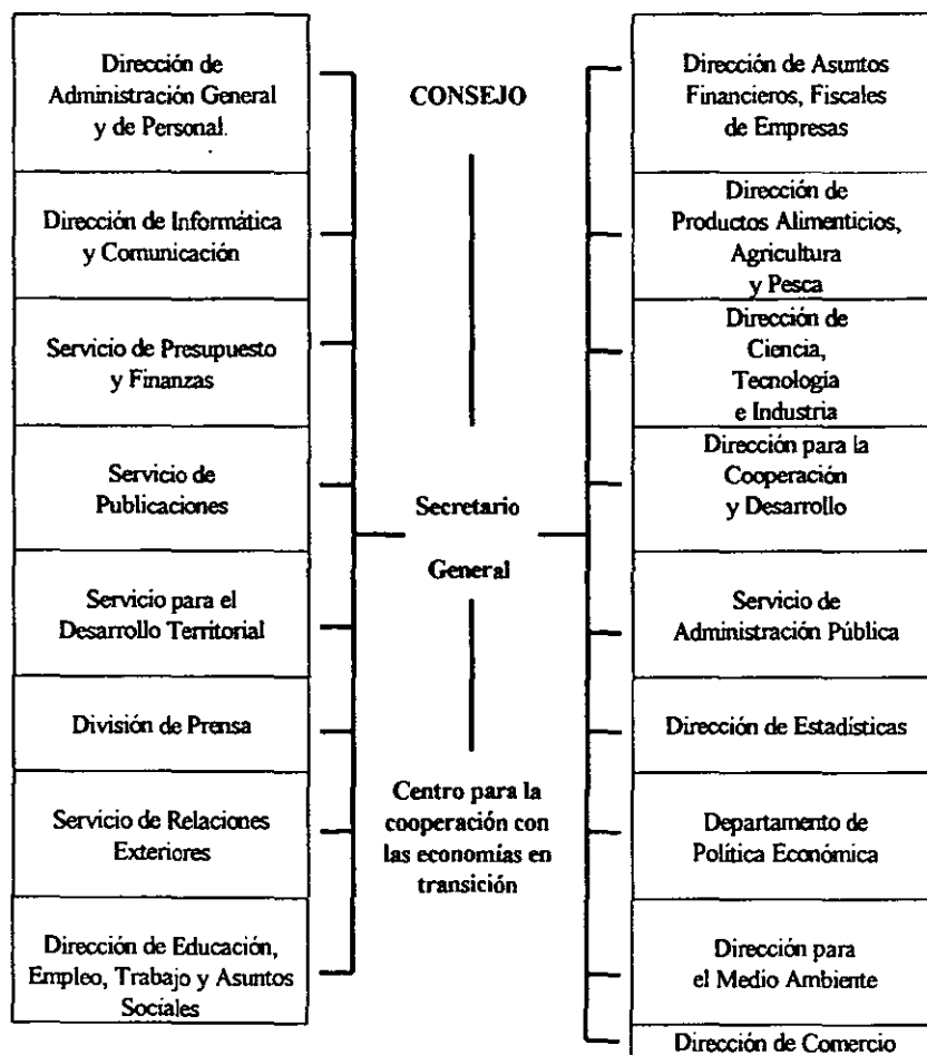
CUADRO II-3. ESTRUCTURA SIMPLIFICADA DE LA OCDE