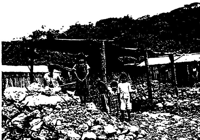
Niños refugiados alrededor del horno para pan; principal sustento económico en el campamento “La Sombra”, Chiapas, México, 1997.