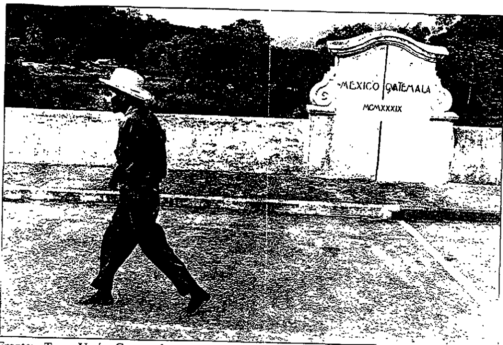
Frontera Tecun Umán, Guatemala. 1982.