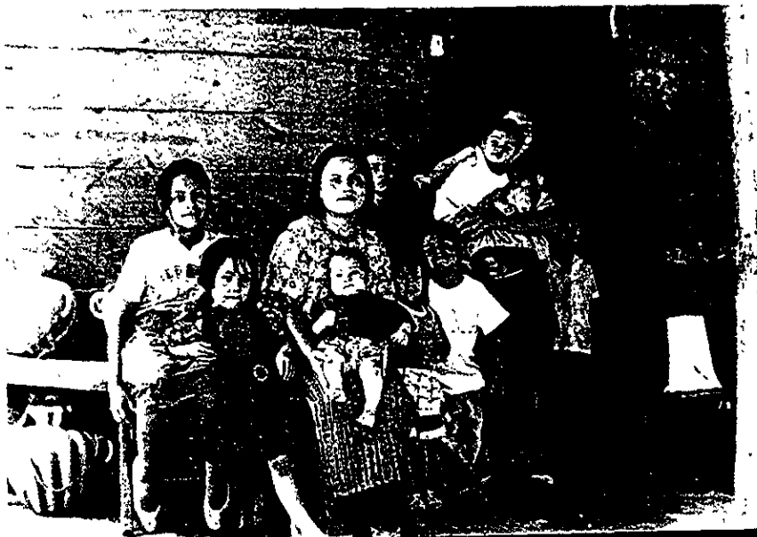
Una familia de refugiados guatemaltecos. Campamento “La Gloria”, Chiapas, México, 1997.