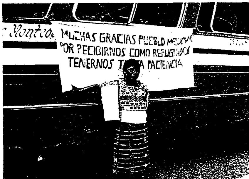
Guatemalteca, perteneciente a la organización de mujeres refugiadas "Madre Tierra". Retorno, Chiapas, México julio de 1997