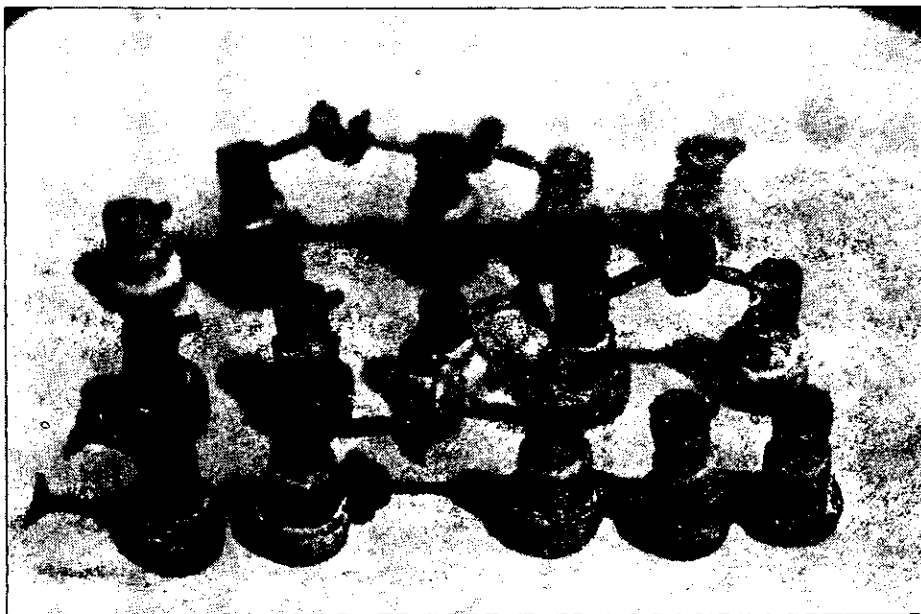
Quince colados de las tres aleaciones (Oro Tipo III, Plata - Paladio, Cobre – Aluminio)