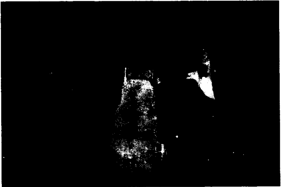
1. Colado Oro Tipo III (Corte vestibular)