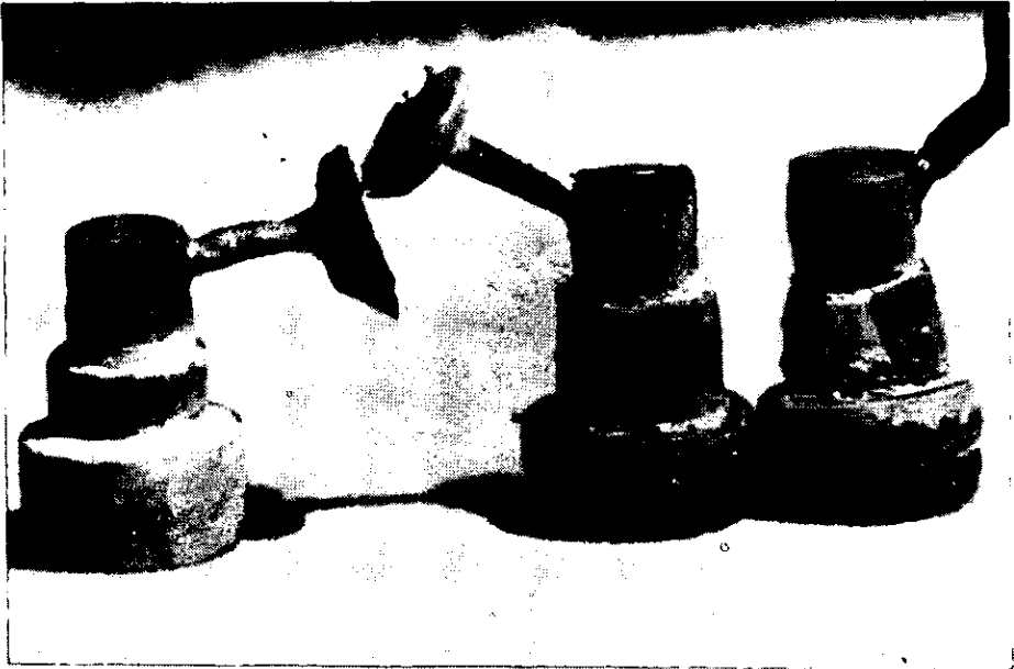
Los tres colados (mejor ajuste)