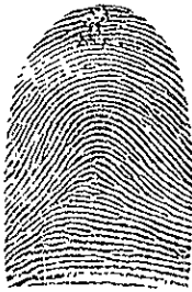
El A (arco) es la figura menos compleja, no tiene delta.

tienen la figura de una delta a la derecha del observador; la presilla externa es la figura que presenta líneas dactilares que convergen a la derecha del observador y tienen la figura de una delta a la izquierda del observador; y el verticilio es la figura dactilar que representa líneas en forma de espiral en el pulpejo del dedo siendo la figura más compleja, por tener siempre dos deltas, una a la izquierda y otra a la derecha del observador.