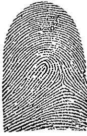
La presilla I tiene el delta a la derecha del observador.