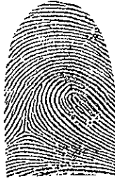
La presilla E tiene el delta a la izquierda del observador y las líneas convergen a la derecha del observador.