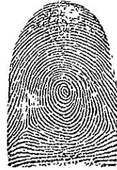
El verticilio es la figura más compleja, por tener dos deltas, uno a la derecha y el otro a la izquierda del observador.

La Dactiloscopia posee la cualidad de otorgar con precisión la identidad de las personas, ya que todos los individuos presentan huellas dactilares totalmente distintas en relación con los demás, y no sólo eso, sino que cada dedo presenta características distintas con el resto, lo que va a permitir obtener la identidad de las personas sin margen de error, existen muchos dibujos dactilares parecidos, pero no iguales. Estas impresiones persisten en el individuo durante toda su vida.