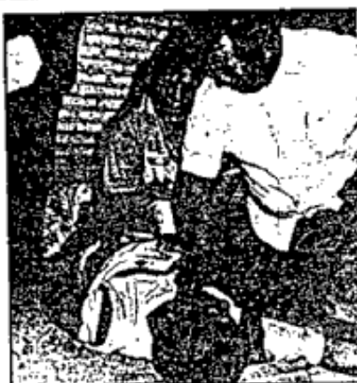
Los padres del conductor del autobús llegaron hasta donde se balaceó su hijo, para exigir justicia y castigo contra los asesinos.

carretera a una distancia que iba en el interior del autobús y quien era acompañado por otro de apellido desconocido 17 años, vestido únicamente con camiseta y pantalón color negro. r-4 Una segunda vez por varios delincuentes se interrumpió el trabajo del chofer, a quien quitaron el dinero recabado por el cobro, acción que le molestó, por lo que al bajar los individuos le propusieron un monto al menor de cinco y rebajado a cinco se componen se separó y tanto por el dueño al conductor, como el conductor al propietario del camionado. r-5 Sup. r-6