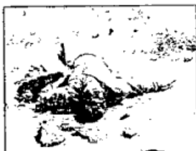
Ya en estado de putrefacción y en el fondo de un barranco, fue encontrado el cadáver de Felipe Morales Guerrero.