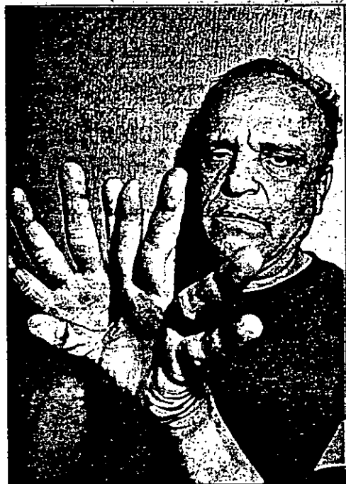
Aquí, las manos asesinas

1. Violento suleto sacrificó con más de 17 puñaladas a su 2. hermano, sólo porque no lo dejaba dormir debido al ruido 3. que hacía con varios drogadictos afuera de la vecindad 4. donde vivían. → 1.