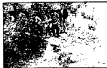
Aperto de la policía Judicial y peritos en criminalística durante el levantamiento de los hechos e inclusión de los investigadores.