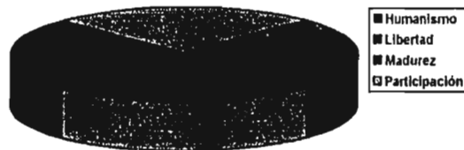
FIGURA 5.2 Democracia

- esquema de interacción del gobierno democrático