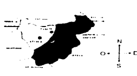
Figura 1.- Ubicación del municipio de Taxco. Figura 2.- Ubicación de la comunidad de Atzala.

Actualmente colinda al norte con San Pedro Chichila, al sur con la comunidad de Paintla, al este con Cacafotenango, y al oeste con Ixcateopan de Cuauhtémoc (fig. 2). Su clima es templado tropical y por la comunidad pasa el río Atzala, este afluente nace al poniente a unos 3 kilómetros de distancia, precisamente en el cerro denominado Piedra Ancha, cercano a otro que se denomina Cerro Áspero. Las aguas del río aparentan ser de gruta y por su calidad sirven para alimentar a varias poblaciones mediante pozos que la propia naturaleza ha formado (13, 14).