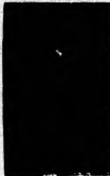
Dintel 25, de la Estructura 23 Dintel Esculpido en Yaxchilan La Civilización Maya Sivanus G. Morley P.369

La mayoría de sus esculturas están hechas en piedra; Las estelas, los altares, las mesas y los tronos ceremoniales, los tableros y las lapidas, los dinteles y los mascarones del juego de pelota, además de mascarones y escaleras labradas.