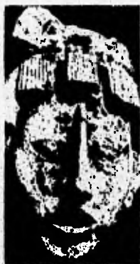
Máscara de Estuco de la Época Clásica La Civilización Maya Sylvanus G. Morley

el barro permitía ser vaciado en moldes y del cual se obtenían pequeñas esculturas de bulto.