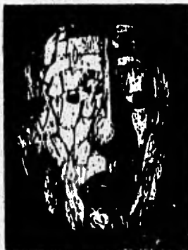
Máscara con Mosaico de Jade. Palenque Chiapas. 400-800d.c. Tesoros Artísticos del Museo Nacional de Antropología. P. 139