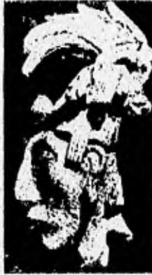
Máscara de estuco, mostrando el perfil de tipo Epoca clásica La Civilización Maya Silvanus G. Morley P.429