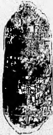
Estela 10 ( Vista de Frente ). El Peten. La Civilización Maya. Sylvanus G. Morley P. 320

La erección de estelas fue común en casi toda el área maya pero claro que cada sitio conservaría su propia expresión de matiz regional.