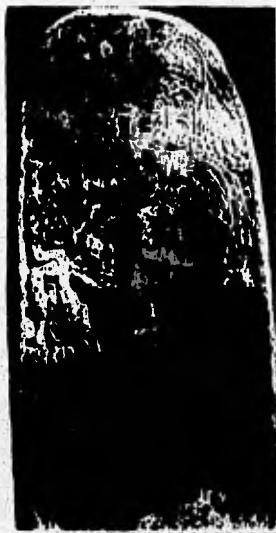
Estela 2, Tikal. Monumento de la Época Clásica La Civilización Maya Sylvanus G. Morley. P.351.

El grabado o sea el dibujo inciso realizado con un instrumento agudo, fue también practicado por los mayas.