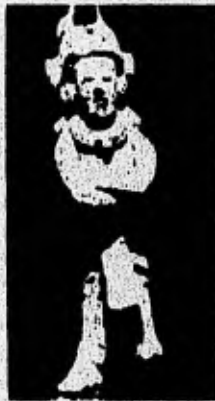
Figurilla de Barro de la Isa de Jaina. La Civilización Maya Sylvanus G. Morley P.380.

Una de las peculiares esculturas en barro son los llamados incensarios o urnas cilíndricas huecas, que tienen al frente una cara o mascarón sobre el cual se superponen cuatro o cinco motivos de mascarones y pájaros alternados. Los mas conocidos de estos los podemos encontrar al pie del templo de la cruz follada en palenque y semejantes a ellos son la urna de Teapa, del museo de Villahermosa.