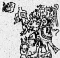
El Dios del Viento, Tal vez Kukulcán La Civilización Maya Sylvanus G. Morley. P.215

Es el intermediario entre el mundo de los vivos y de los muertos. Otra pareja de dioses son los ancianos que conducían a los difuntos al inframundo.