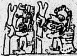
El Dios de la lluvia alimenta a un árbol; el dios de la muerte lo arranca. La Civilización Maya Sylvanus G. Morley P.206

La religión sufrió un importante cambio cuando llegaron los españoles a imponerles la religión cristiana en lugar de las antiguas creencias y practicas idolatricas, el dios cristiano era el un dios muy celoso y sus mienbros llegaron a la conclusión de que los sacerdotes indígenas debían abandonar sus antiguas creencias o ser deteminados. Y con ellas se hundieron la vieja religión esotérica, la ciencia y la filosofía, mientras que la fe sencilla del pueblo ordinario, mucho mas difundida, ha sobrevivido en parte hasta nuestros días.