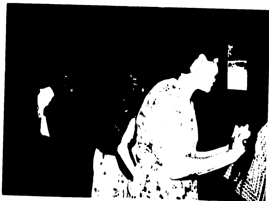
10.-MUJERES INDIGENAS DE OAXACA EN ACTIVIDADES CON CAM.