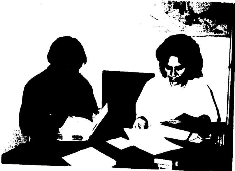
1.-FUNDADORAS DEL CAM.