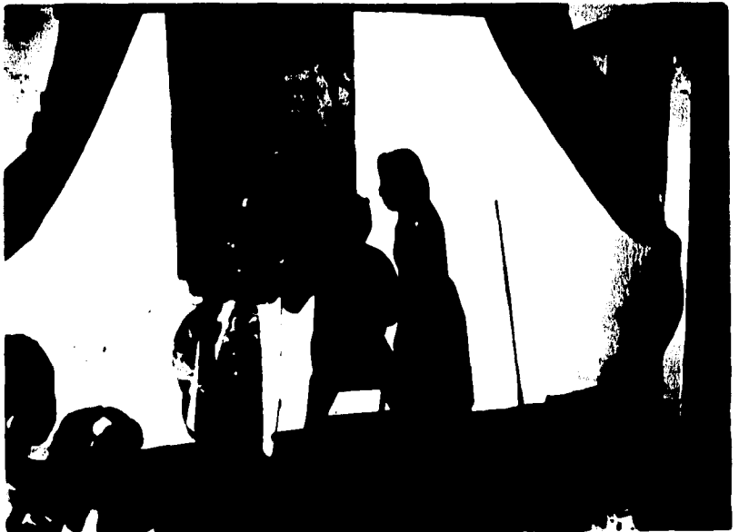
8.-TECNICAS UTILIZADAS EN LA FORMACION Y CAPACITACION.