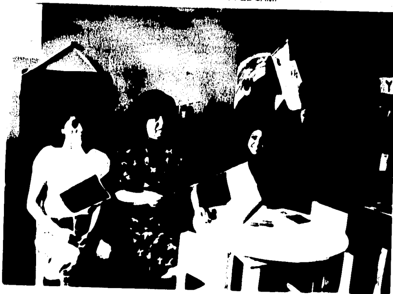
2.-UNION DE MUJERES DE IXTLAHUACAN