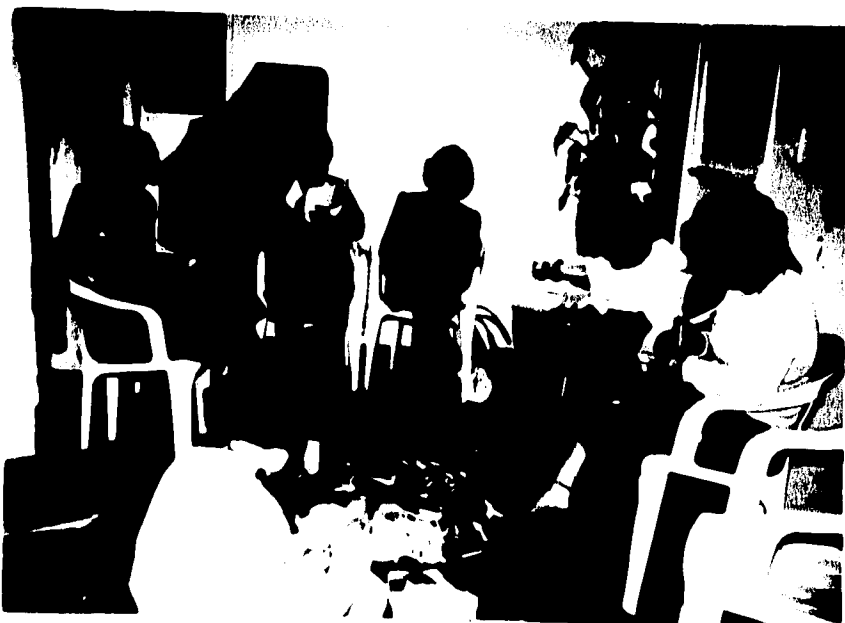
9.-TECNICA DE RECONOCIMIENTO A TRAVES DEL DESARROLLO CREATIVO.