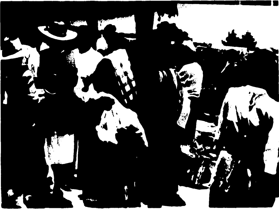
7.-VENTA DE DESPENSAS EN LA COMUNIDAD MAZAHUA DEL ESTADO DE MEXICO