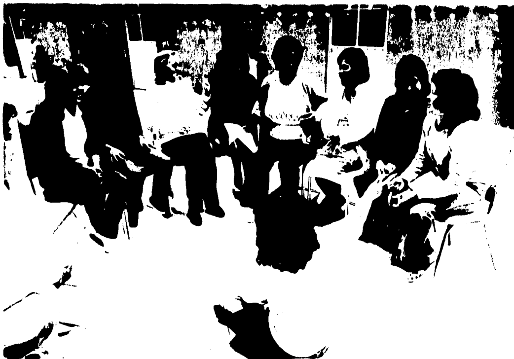
3.-PRIMEROS TALLERES REALIZADOS EN CAM.