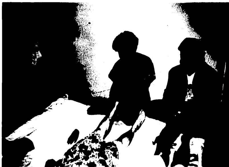
4.-TALLER SOBRE TECNICAS DE MASAJE -AREA DE SALUD-