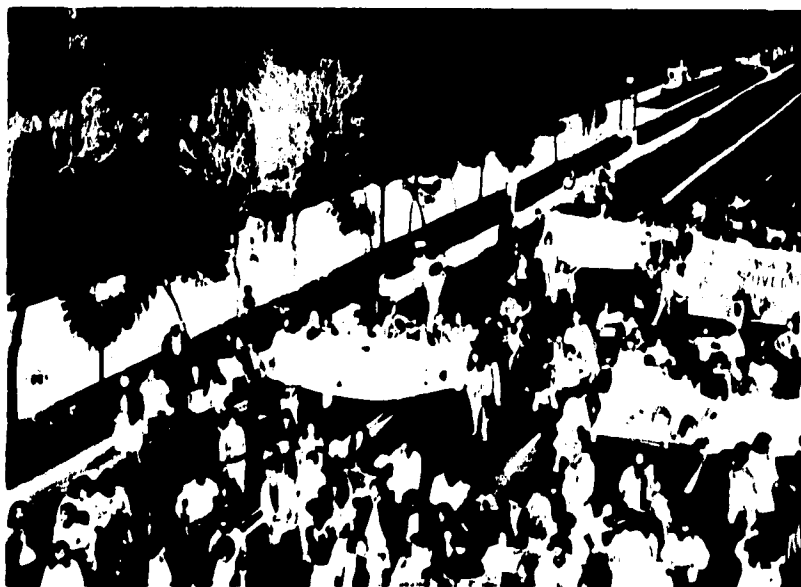
6.-MOVILIZACIONES POPULARES PARA EXIGIR LOS DERECHOS DE LAS MUJERES