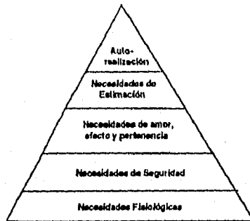
Pirámide de las Necesidades de Maslow

Maslow distingue dos tipos de creatividad, la primera de talento especial y la segunda de autorrealización; la primera, es el resultado de habilidades superiores y, la segunda, depende de la personalidad del sujeto.