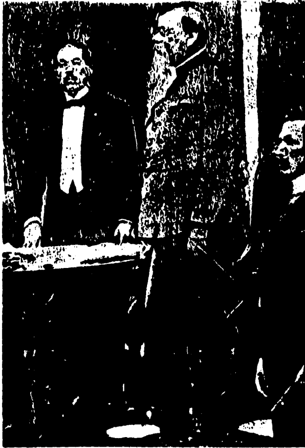
Don Venustiano Carranza protesta cumplir la nueva Constitución. Sesión de clausura 31 de enero de 1917.