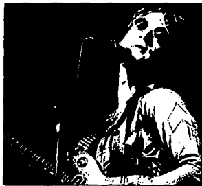
John en Central Park

Para mitigar la desconfianza que el gobierno le tenía, John se presentó el 30 de agosto de 1972 en el Concierto Uno por Uno, en el Madison Square Garden. Era un concierto a beneficio de los niños con retraso mental, al que asistieron varias personalidades gubernamentales que atestiguaron la buena fe de los Lennon. En la actuación Yoko simulaba tocar el teclado para demostrar que era útil a La Banda Plástica Ono. Reunieron alrededor de un millón quinientos mil dólares para la causa y John logró un punto a favor en su relación con el país.