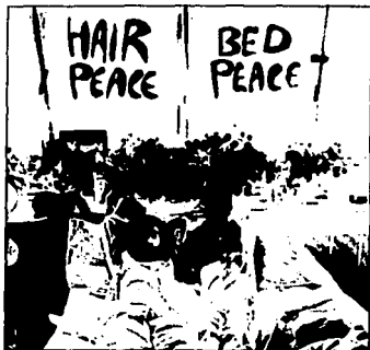
Den oportunidad a la paz

A finales de mayo, John y Yoko se disponían a abordar el barco Queen Elizabeth II , pero se encontraron con la noticia de que las autoridades migratorias estadounidenses negaban el visado a John Lennon por su antecedente de posesión de drogas. Optaron por tomar un vuelo con destino a Las Bahamas, pero al llegar se dieron cuenta que no era posible realizar una protesta desde ahí. Volaron a Toronto, Canadá, y luego de retenerlos más de dos horas les dieron el permiso para entrar al país.