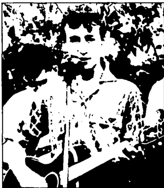
John cuando iniciaba su primera banda