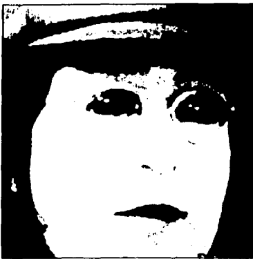
John a punto de caer

Otra de las melodías más destacadas, y no por su mensaje, es How Do You Sleep? (¿Cómo puedes dormir?). Un ataque directo a Paul McCartney, donde Lennon se jacta de ser el creativo del grupo y le dice a Paul que lo único bueno que hizo fue escribir Yesterday (Ayer).