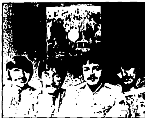
El club de los corazones solitarios.

A pesar de ser una de las obras mejor cuidadas en su producción, se enfrentó a varios problemas, los cuales hubo de explicar uno a uno para aclarar la intención que llevaba cada canción, siendo la más atacada Lucy In The Sky With Diamonds (Lucy en el cielo con diamantes), pues las iniciales de los sustantivos del título coinciden con las del ácido lisérgico LSD. John explicó que era mera coincidencia, pues se había inspirado en un dibujo que Julian había hecho en la escuela con el mismo nombre, le agradó y escribió la canción sin darse cuenta de esta similitud.