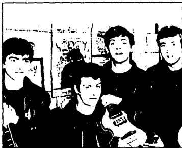
Los Beatles con Pete Best.

Durante su estadia en Hamburgo, los Beatles llevaban una vida precaria respecto a su alimentación y por otro lado se entregaban a los placeres mundanos. Se embriagaban todos los días. Constantemente tenían relaciones sexuales con prostitutas, contagiándose con facilidad de algunas enfermedades venéreas. Su trabajo era muy intenso, actuaban de seis de la tarde a cuatro de la mañana todos los días, lo que los llevó a ingerir anfetaminas sustituyendo a los alimentos y así poder soportar su ritmo de vida.