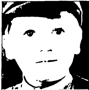
John Lennon a la edad de cuatro años.