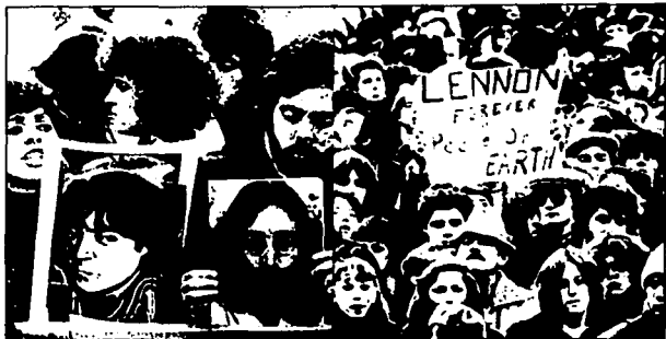
La impotencia, la ira ... el sueño terminó

afirmativamente. Entraron a la sala de emergencia donde los médicos hicieron todo lo posible por salvarlo, sin embargo, ya había perdido demasiada sangre y fue inútil su trabajo.