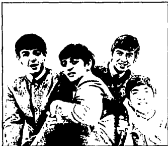
Los Beatles ya con Ringo Starr.

Brian Epstein, a pesar de no conocer el negocio y la falta de apoyo de la compañía disquera, empezó a promocionar el material, usando como estrategia principal, el pedir a su familia y amigos que comenzaran a solicitar en las discotecas el sencillo de los Beatles . Ante esta situación el disco emprendió un rápido ascenso en la lista de ventas en Liverpool. Al ser de fácil acceso el corillo ( Love, love me do you know I love you ), la melodía resultó ser pegajosa y llegó a ocupar el lugar número diecisiete en el cuadro de popularidad.