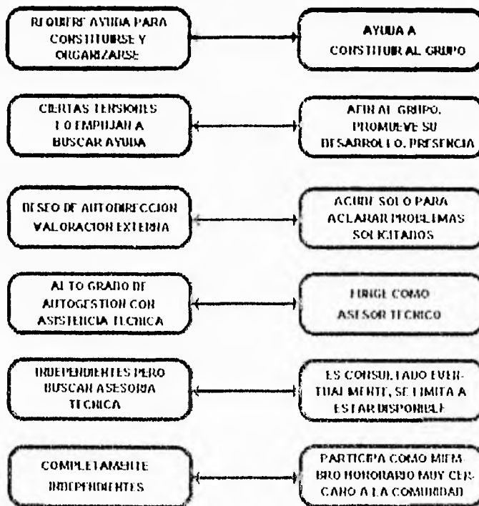
Cuadro 2.- Realizado en base al análisis anterior.