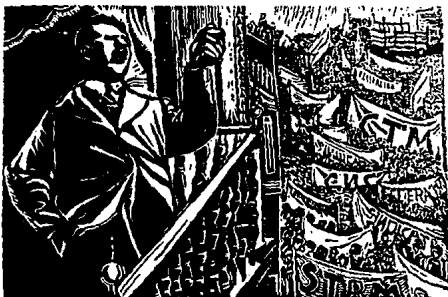
IGNACIO AGUIRRE. "EL GRAL. CARDENAS".