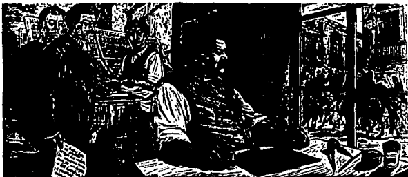
LEOPOLDO MENDEZ. "JOSE GUADALUPE POSADA".