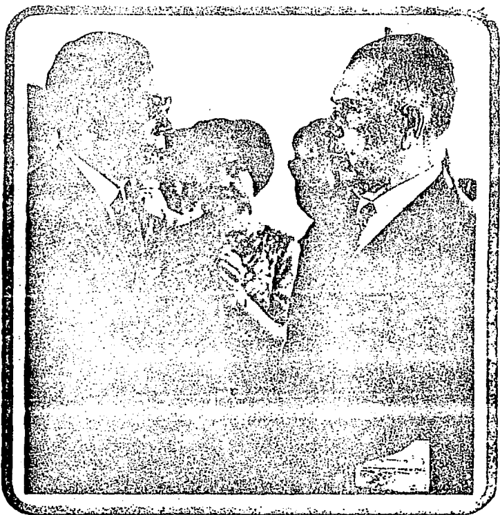
GUSTAVO DIAZ ORDAZ Y LAZARO CARDENAS