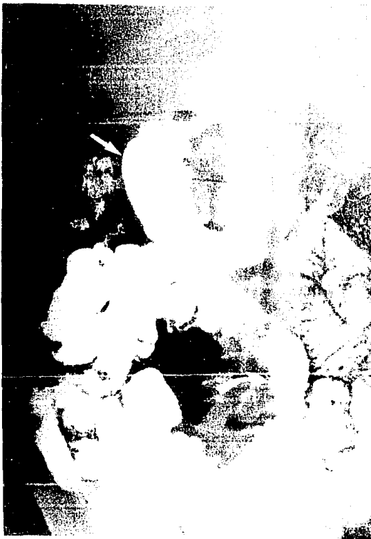
FIG 3: FORMA CIRCUNFERENCIAL Y NODULAR MULTIPLE SITUADA EN DUODENO (FLECHA) E ILEON PROXIMAL (FLECHA CURVA).