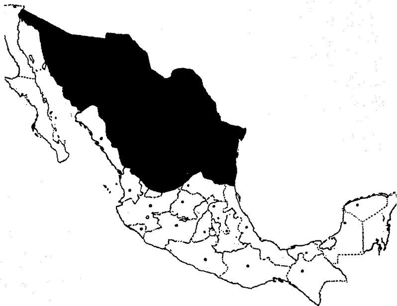
FIG. 1: DEMARCACION DE LA REGION CON CUOTAS DE EXPORTACION DE BECERROS MACHOS