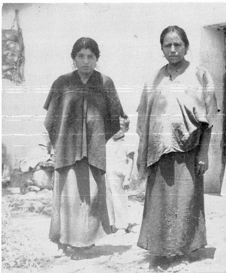
En Tetelcingo la mujer es devaluada respecto del hombre.