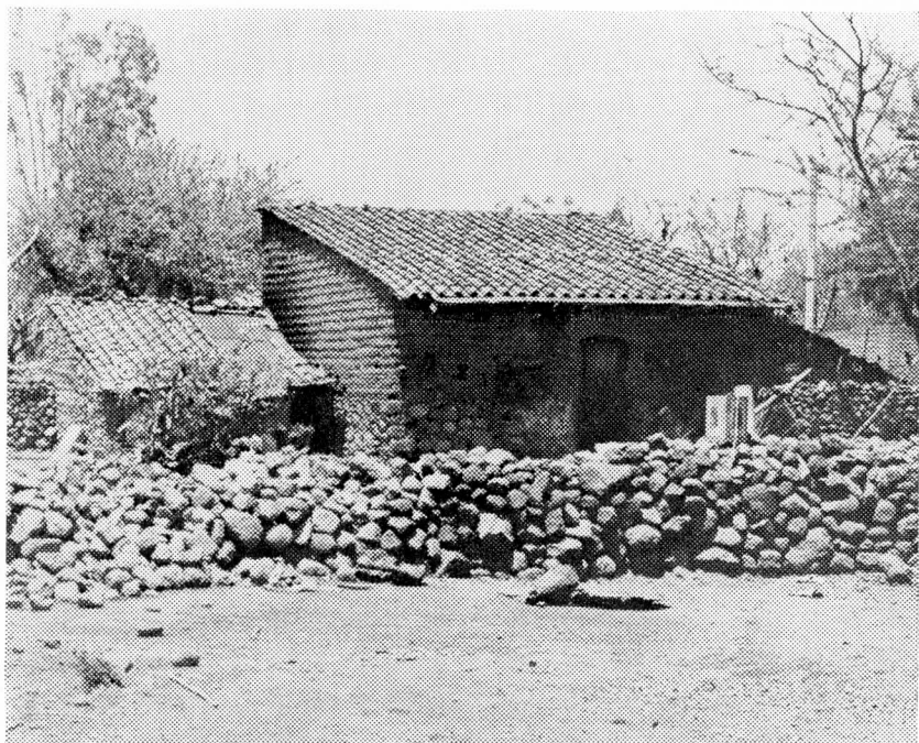
El tipo de casa con techo a una sola agua, construidas de adobe y teja.