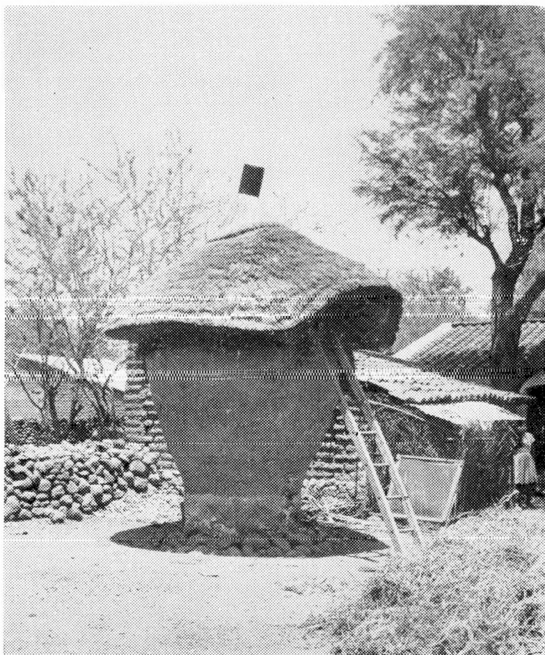
Almacenan su cosecha en el tezcomate como sistema de previsión de tipo alimenticio.