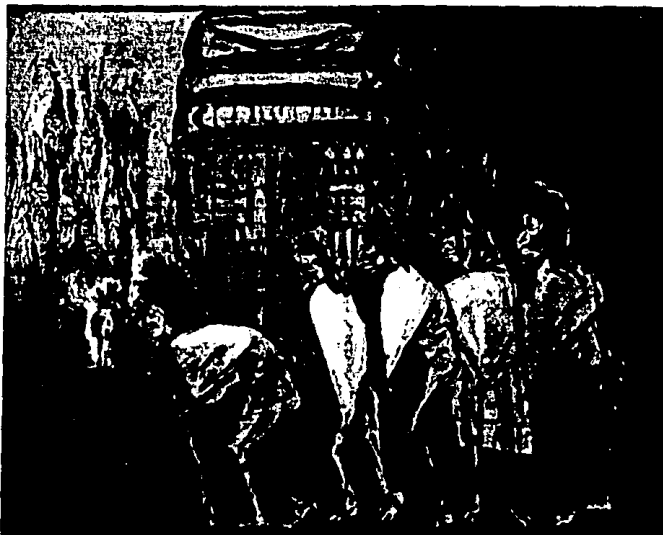
" LOS TEULES I "

En una serie de imágenes furibundas y piadosas, Orozco expresa con fuerza extraordinaria la "tesis" nacional mexicana de la condena de la destrucción de una civilización autóctona a la que se asigna alto valor.