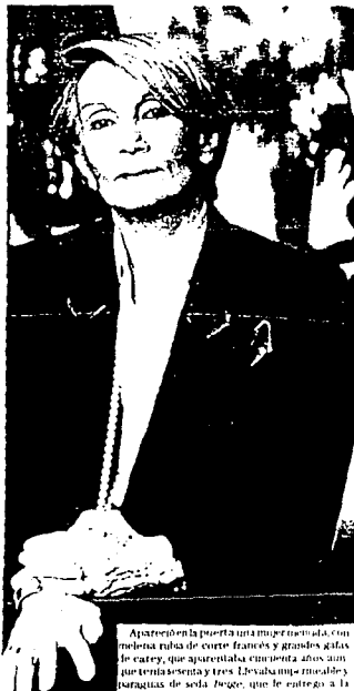
Apareció en la puerta una mujer metida, con melena rubia de corte francés y grandes gafas de carey, que aparentaba cincuenta años aun que tenía sesenta y tres. Llevaba un «rimable» y baraguis de seda beige, que le entregó a la doncella, girando con agilidad y haciendo un risuelo comentando sobre la lluvia. Vestía sweater verde de algodón con cuello alto y falda plisada de lana gris. Su aspecto era el de una dama de la burguesía francesa. Tenía una vitriña plástica fulmíosa, la boca grande, bellos ojos color café y corta expresión de pílete.

14.- Cada vez que una mujer miente acerca de su edad, es cómplice de su propio subdesarrollo como ser humano. Pero las mujeres tienen otra opción: pueden aspirar a ser inteligentes y no sólo agradables, a ser competentes y no sólo serviciales. Las mujeres pueden aspirar a ser ambiciosas para sí mismas y no sólo en relación con el hombre y los hijos. Sólo de esa forma podrán permitirse envejecer con naturalidad y sin dolor. Esta es la única forma de protestar activamente y de desobedecer las convenciones sociales del doble patrón respecto al envejecimiento que ha impuesto la sociedad. Y así en lugar de mantenerse adolecente durante el mayor tiempo posible, y en lugar de pasar con humillación a la madurez, podrán convertirse mucho antes en verdaderas mujeres y ser durante más tiempo adultas activas que saben disfrutar de la larga carrera erótica de que son capaces las mujeres. Las mujeres deben permitir que sus rostros muestren la vida que han vivido. Deben siempre decir la verdad.