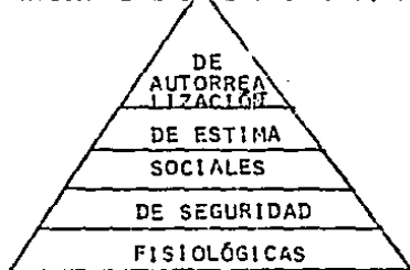
JERARQUÍA DE LAS NECESIDADES, DE MASLOW