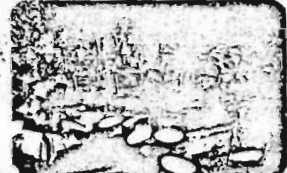
Los jóvenes celebran el primer día del año en un momento de alegría y felicidad. Se ven botellas y vasos sobre una mesa.