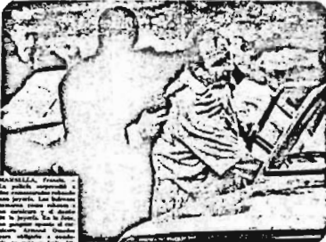
Las mujeres de un incapacitado.