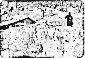
Un paisaje rural en Torreon, Coahuila.