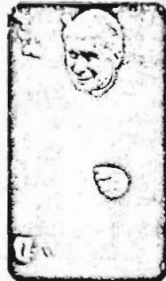
David Rockefeller en un momento de su visita a México. El Sr. Rockefeller es el hombre que se encuentra en la parte superior de la fotografía.

"¿QUI NO LA MABA?" DICEN LOS DEL PAN MEXICO, 17 de Mayo (AP)— Los miembros del Partido Acción Nacional (PAN) dijeron hoy que el gobierno federal está tratando de ocultar la verdad sobre el asesinato de un líder del partido. El PAN dijo que el gobierno está tratando de ocultar la identidad del asesino y que esto es una violación de la ley.