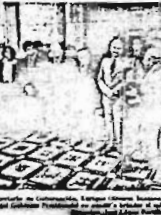
La cabeza de la viuda se tambalea.

Por WALTER DOMÍNGUEZ La cabeza de la viuda se tambalea debido a la escasez de alimentos en el mercado. SIN QUERER QUERIENDO • G. Pasco: extraordinario • J.P. (Ora ve) Reagan? • Carvajal: SDC-Desempeño Por WALTER DOMÍNGUEZ