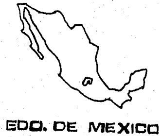
EDO. DE MEXICO