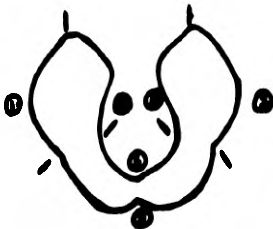
Zonas Periféricas de la Mandíbula.