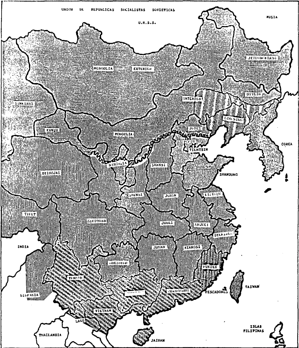
Mapa No. 1.